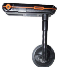
取付け器具STD-HDDV(別売り) 設置図